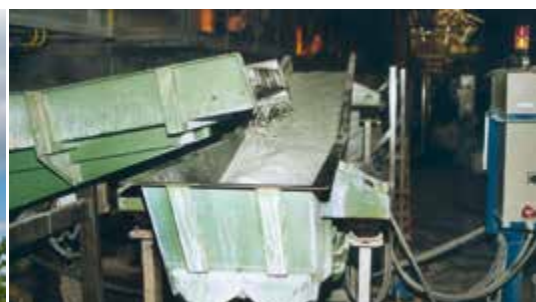
Sector cerámico y vidrio