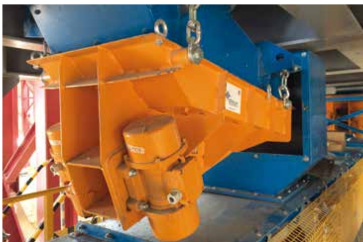
Alimentador vibrante electromecánico