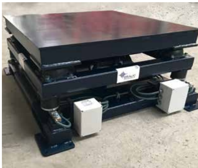
Mesa vibrante de compactación