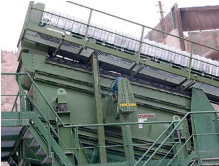
Criba de malla elástica Binder BIVITEC