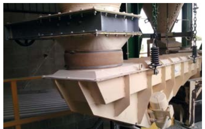
Transportador vibrante electromecánico