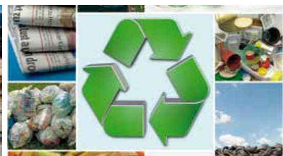
Sector de reciclagem e resíduos