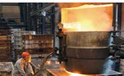
Sector siderúrgico e metalúrgico