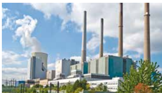
Sector químico e plásticos