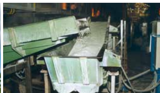
Sector cerâmico e vidro