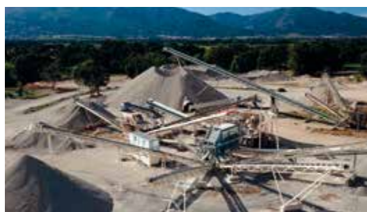
Sector de agregados e mineração